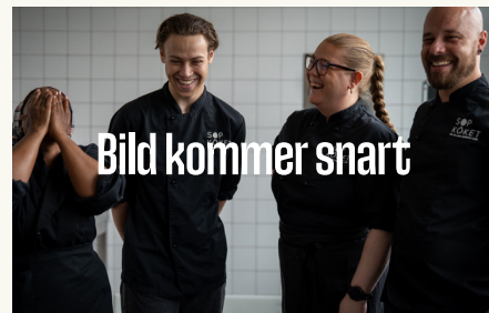
Bild kommer snart